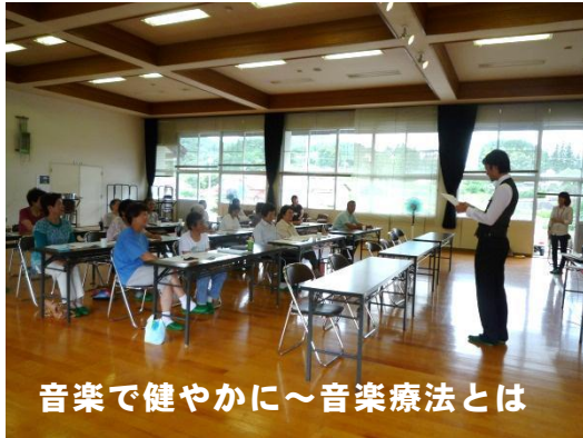
音楽で健やかに～音楽療法とは