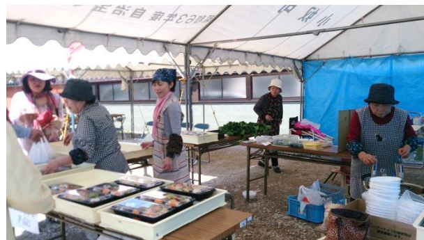
4月18日(土)小奴可の要害桜 旧堀田邸跡駐車場で地元有志がお花見弁当やおはぎ、麺類などを販売しました。