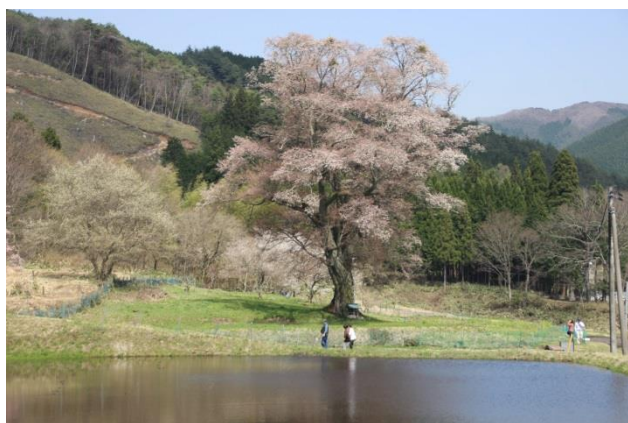
4月18日(土)千鳥別尺のヤマザクラ