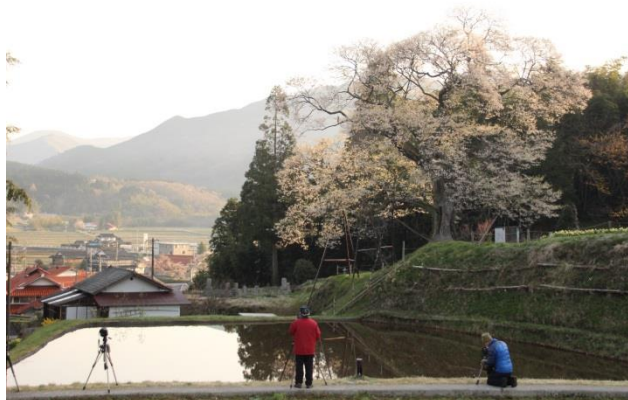
4月18日(土)小奴可の要害桜